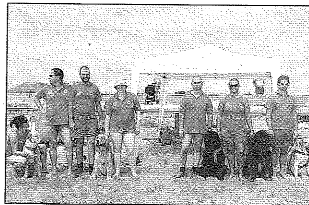
La squadra di salvataggio in mare della protezione civile

sportato dalla forte corrente, contro la scogliera che delimita e separa la spiaggia della Costa Azzurra dal canale d'accesso a Grado dove il traffico dei natanti è sempre molto sostenuto. Soccorso dal cane e dal suo addestratore, l'anziano è stato riaccompagnato a terra dove ha ringraziato i soccorritori perché le conseguenze sarebbero state di non poco contro se avesse sbattuto contro la scogliera, forse poteva pure annegare.